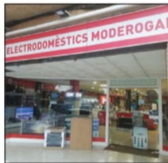
Electrodomèstics Moderoga (Tortosa)