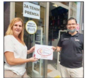
La Vintage (Sant Jaume d'Enveja)