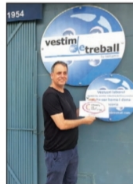
Vestim de Treball (Deltebre)